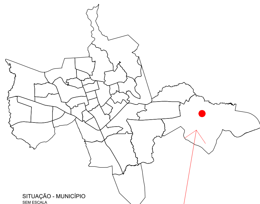
SITUAÇÃO - MUNICÍPIO SEM ESCALA